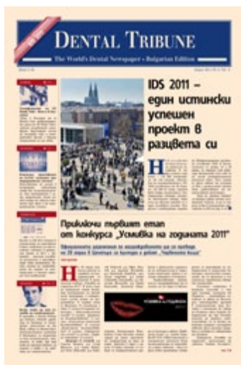
Dental Tribune The World's Dental Newspaper - Bulgarian Edition