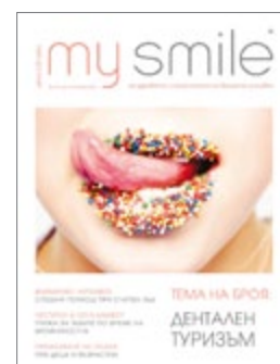
My Smile списание за здравето и красотата на Вашата усмивка