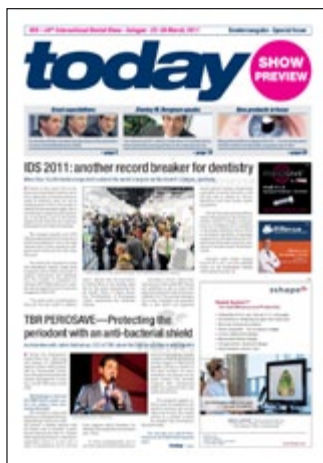
Today бизнес гайдът на „Булмедика/ Булдентал“