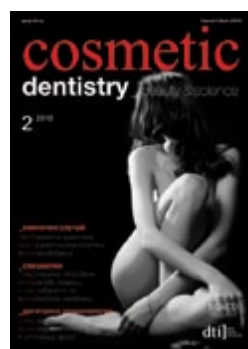
Cosmetic Dentistry beauty and science magazine